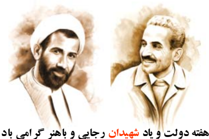
هفته دولت و یاد شهیدان رجایی و باهنر گرامی باد