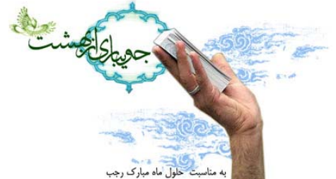
به مناسبت حلول ماه مبارک رجب