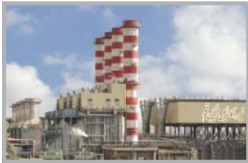
افزایش تولید در مردادماه