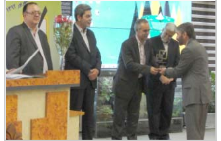
«به مناسبت فرارسیدن هفته دفاع مقدس»

بزرگداشت هفته دفاع مقدس نه به عنوان یک بزرگداشت، صرف یادآوری خاطرات مربوط به دو دهه پیش، بلکه محملی برای بارور ساختن جریان و مرامی است که حالا دیگر به شالوده اساسی نظام کشور تبدیل شده است. بزرگداشت هفته دفاع مقدس، یادآوری و مرور مداوم و مستمر آن غنای فرهنگی است که در یک دوره سخت هشت ساله برای کشور ما به دست آمد و می تواند پشتوانه عملی و نظری استواری برای آینده این ملت باشد. پشتوانه ای آکنده از شهامت، ایثار، حماسه و ایمان.