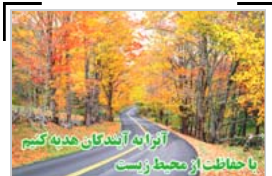
آرزو به آنگدگان هدیه کنیم با حفاظت از محیط زیست