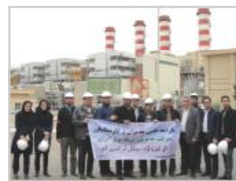
آن ارائه نمودند.

در این بازدید که از قسمت‌های مختلف نیروگاه انجام شد کارشناسان مربوطه توضیحات لازم را در رابطه با فرآیند تولید برق و توزیع