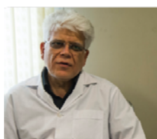
معرفی پزشک جدید