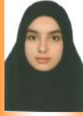
آرزو خیرخواهان پایه ششم خیلی خوب