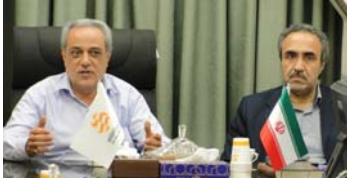
نشست مدیریت با کارکنان نیروگاه قم