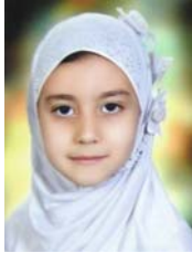
مهکامه کریمپور پایه دوم خیلی خوب