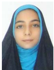
ستایش صحرایی پایه ششم خیلی خوب